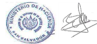
Carlos Enrique Cáceres Chávez Ministro de Hacienda