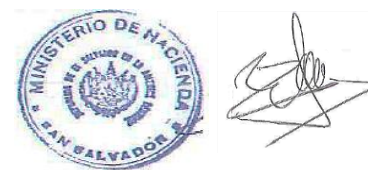
Carlos Enrique Cáceres Chávez Ministro de Hacienda

DIRECCIÓN GENERAL DE CONTABILIDAD GUBERNAMENTAL : San Salvador, 15 de marzo de 2017