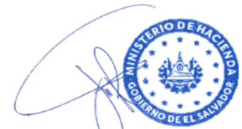
Jerson Rogelio Posada Molina Ministro de Hacienda